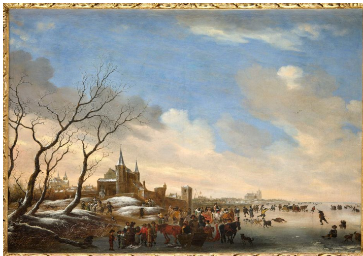
Salomon van Ruysdael, La Vente de poissons, 1657, huile sur toile, La Fère, musée Jeanne d'Aboville

Dans le cadre du projet « Heures italiennes », le musée de Soissons prête quelques tableaux parmi les plus précieux de son fonds. Ce départ important d'œuvres fournit l'occasion d'axer la présentation des peintures sur l'autre point fort du fonds soissonnais en mettant à l'honneur le musée de La Fère.